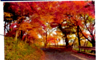
海老原医院付近の道路沿い(約20本)